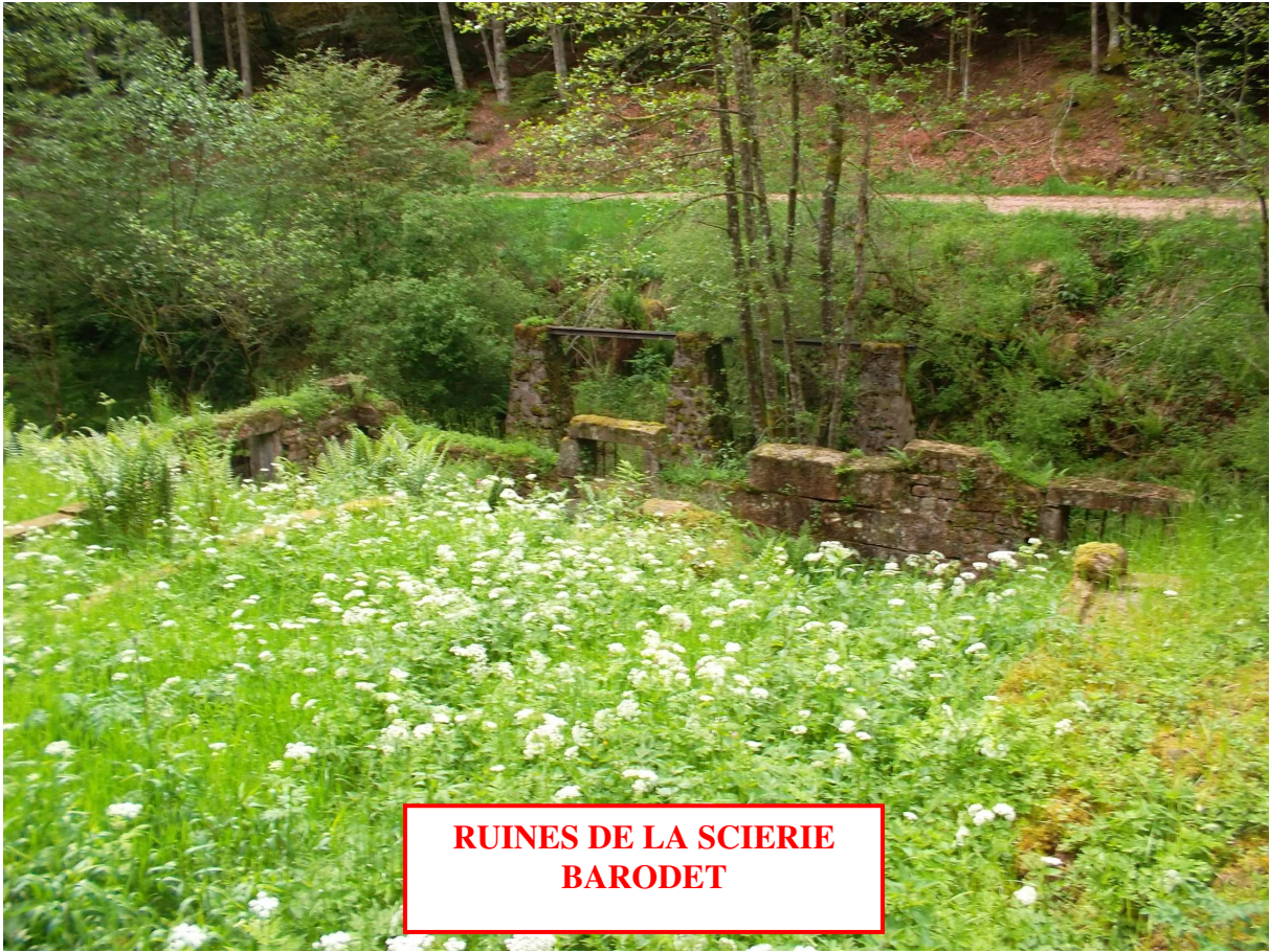
RUINES DE LA SCIERIE BARODET