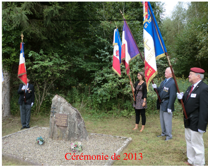
Cérémonie de 2013