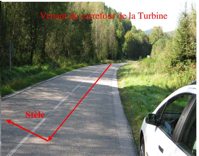
Venant du carrefour de la Turbine