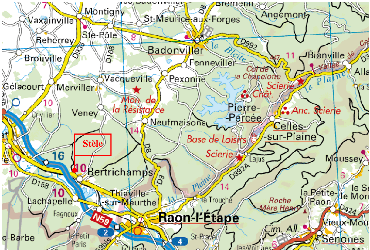
EXTRAIT DE PLAN AU 1/25000